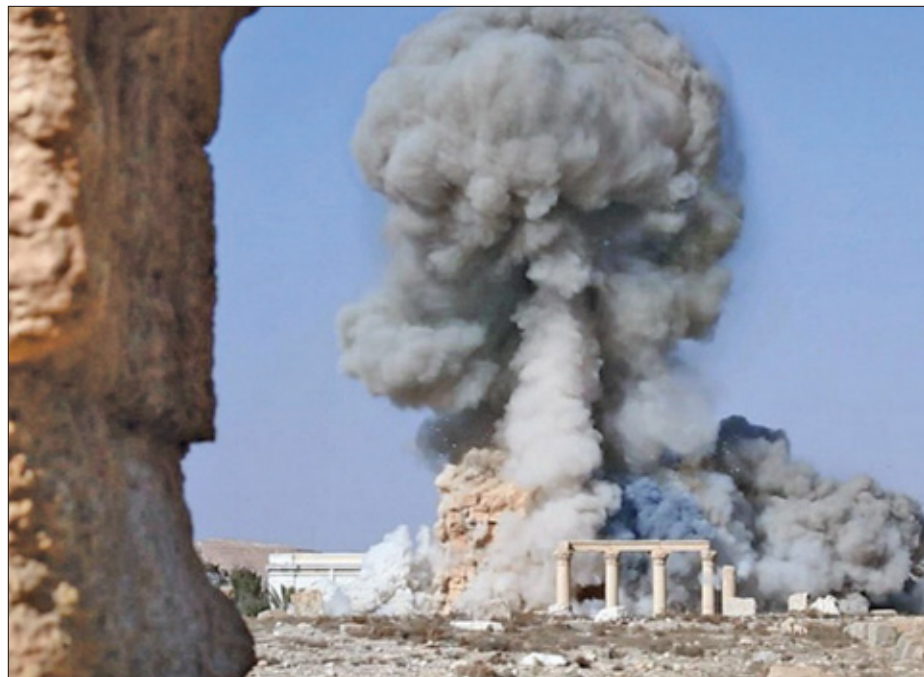
IS zou de beelden, de stenen fronten en fresco's aan internationale handelaren verkopen en daarna zou de terreurbeweging de tempels en gebouwen opblazen om het bewijs van de plundering te vernietigen.

tactiek. „Ze begonnen met hammers en grote machines. Ze bleizen Nimrud in één dag op. Maar dat gaf ze maar twintig seconden film. Nu hoeven ze niet eens meer de vernietiging van zo'n plek op te eisen. Dat doen