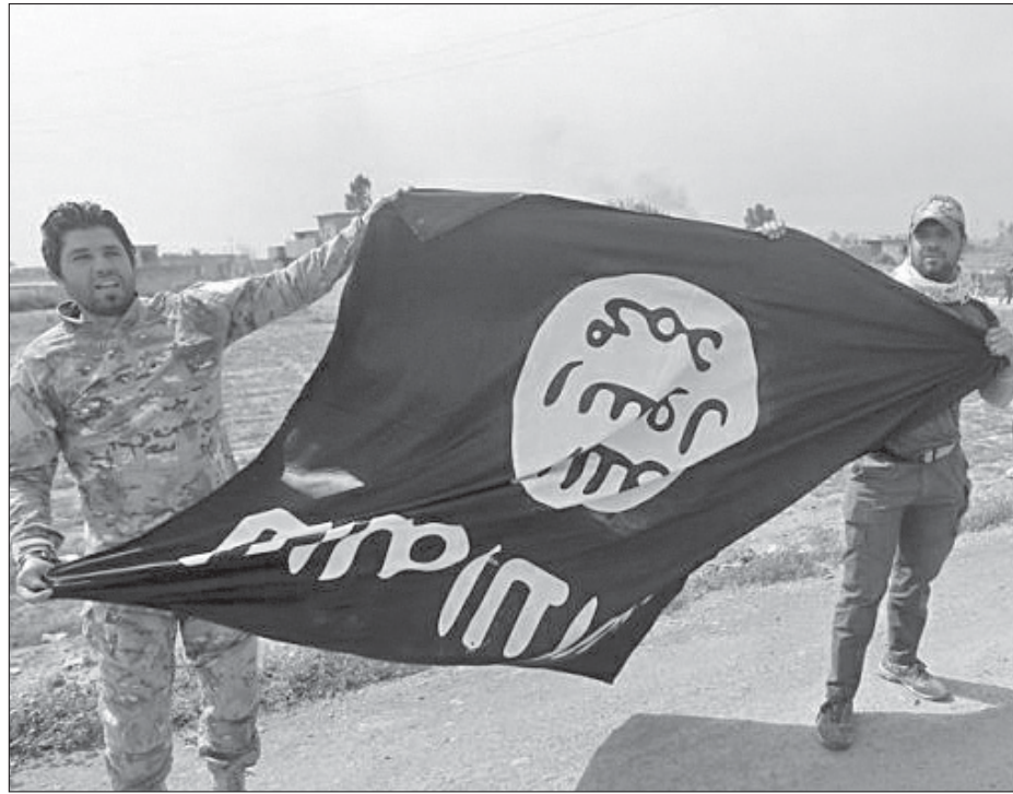
Politiek Den Haag reageerde geschokt op het overlopen van een Nederlandse militair naar IS.