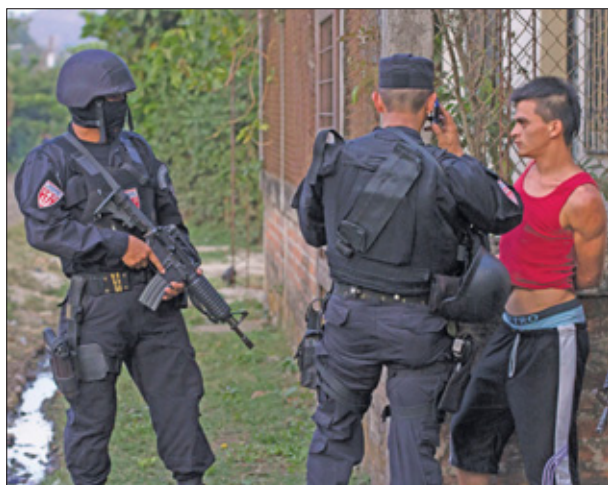
Het geweld neemt steeds verder toe sinds een wapenstilstand tus-

der toe sinds een wapenstilstand tussen de twee grootste bendes eindigde. De politie schat dat zo-