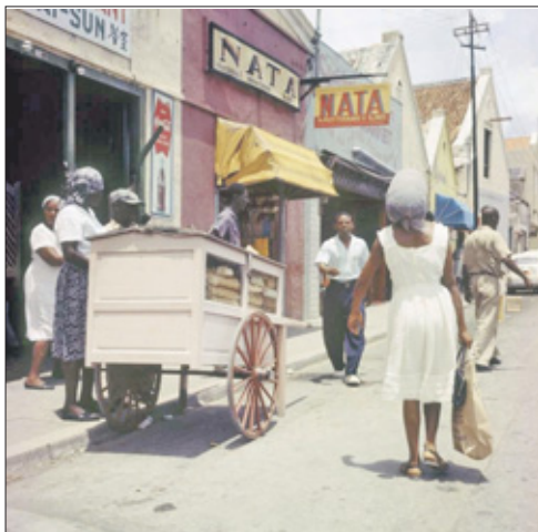
Vrouwen die sneller in de prostitutie terecht kwamen waren de verkoopsters in mooie kledingszakken.