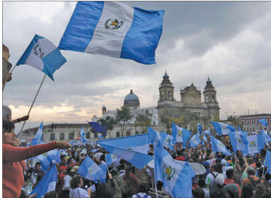
Sinds het schandaal bekend werd volgen de protestmanifestaties elkaar op.

Begin mei 2014 diende zij zelf al haar ontslag in, met de verkiezingen van 6 september in het vizier. Zij wacht nu goed beschut op haar proces in een militaire kazernes, ver van de gore gevangnissen waarin de gewone Guatemalteek van de straat terecht komt. Amilcar Pop, Maya Q'eqchi', advocaat en volksvertegenwoordiger, diende klacht