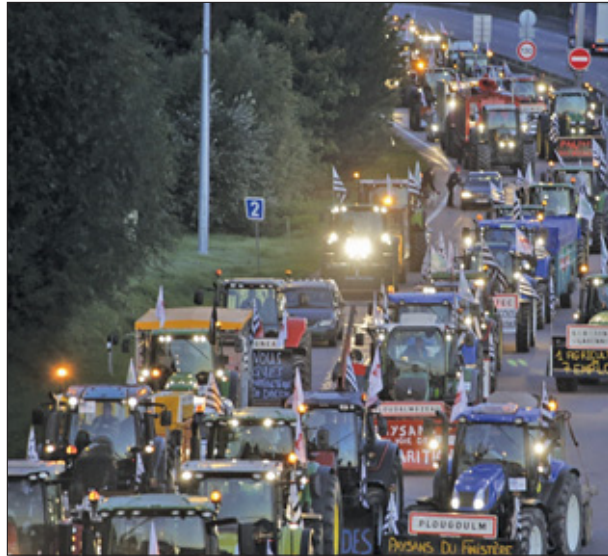
Met naar schatting 1.700 tractors en in ruim negentig bussen kwamen Franse boeren 's ochtends naar de hoofdstad.

De cijfers van het ministerie van Landbouw geven de boeren gelijk. Volgens het departement balanceert 10 procent van de boeren op de rand van faillissement en heeft de agrarische sector een schuld van 1 miljard euro uitstaan. Het is nog niet duidelijk wanneer de ongeveer 5000 boeren rechtsomkeert maken en de Franse hoofdstad weer verlaten. Sommige deelnemers aan de actie zijn op hun tractor met een gemiddelde snelheid van 35 kilometer per uur meer dan een week onderweg geweest om Parijs te bereiken.