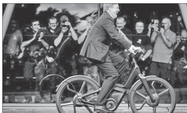
Koning Willem-Alexander fietste een rondje op een elektrische fiets.

De politie heeft onderzoek gedaan en zegt dat er geen concrete aanwijzing is 'dat deze locatie een potentieel doelwit zou zijn'. Dit staat ook in een brief die de scholen aan de ouders hebben geschreven. De Haagse burgemeester Jozias van Aartsen liet later op de dag via Twitter ook weten dat er geen concrete dreiging is. „Gebruik gezond verstand. Loswoelen van onnodige onrust is schadelijk”, stelt hij op het account van de gemeente.