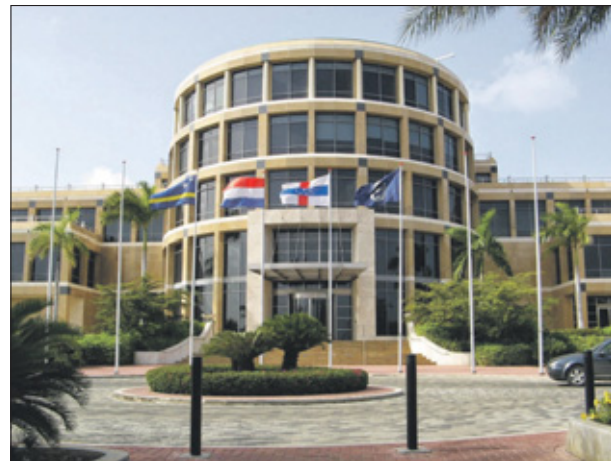
De Centrale Bank van Curaçao en Sint Maarten.

Op pagina 12 Verschil groei Sint Maarten en Curaçao