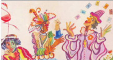
De expositie heeft als thema 'een dag in het circus'.