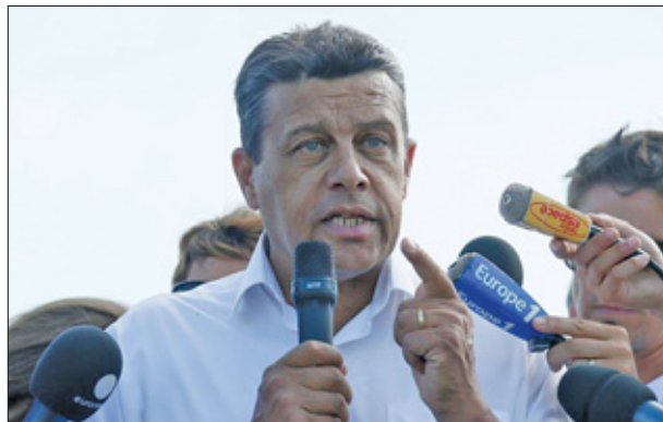
De premier van Frankrijk zou de noodlijdende agrarische sector gisteren over een periode van drie jaar 3 miljard euro steun hebben toegezegd.