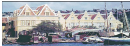
Een prostituee kon zich gemakkelijk schuilhouden maar verraadde haar status als ze zich midden op de dag moest begeven naar het smalle steegje te Scharloo waar vroeger de Medische Controle Dienst gevestigd was. Op de foto 'De vijf zinnen' op Scharloo.

In de ochtenduren van 12 juli 1922 begaf de 22-jarige jongedame Swinda zich naar het destijds aan het Wilhelmínplein gelegen