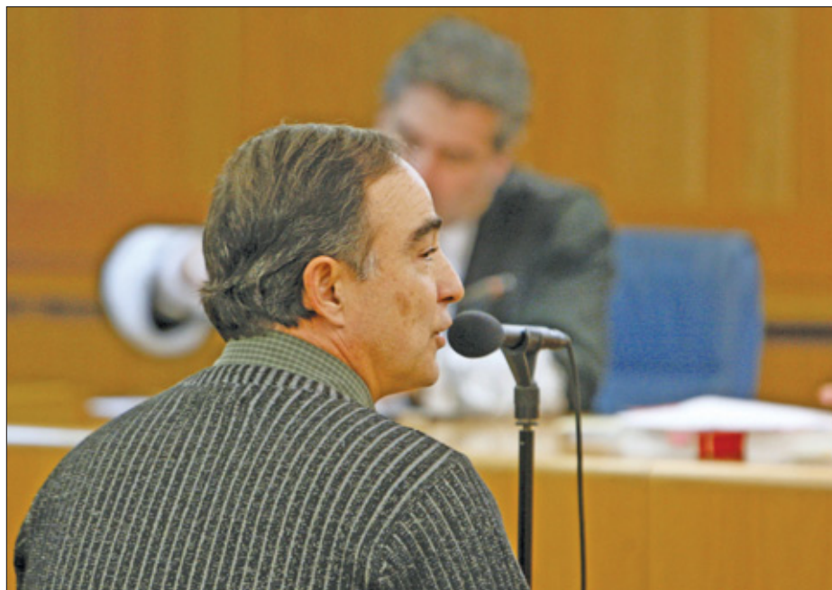
Poch heeft gezegd dat hij de transportvliegtuigen die voor de dodenvluchten zijn gebruikt niet kan vliegen, maar volgens het OM is dat niet waar.

Ook spreekt justitie Pochs bevestiging tegen dat de legereenheid waarvoor hij werkte alleen gevechtstaken uitvoerde. Er is