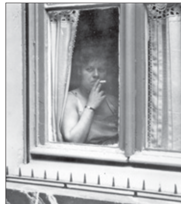
De Nederlandse gemeenten waren overgegaan tot opheffing van het prostitutieverbod buiten de officiële bordelen om, waaruit de latere raamprostitutie gegroeid is.