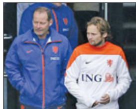
Nog nooit eerder stelde een bondscoach van Oranje zijn zoon op.

nationale geschiedenis. Vader Cesare Maldini en zoon Paolo werkten samen bij de Italiaanse ploeg. In Kroatië koos Zlatko Kranjcar voor zijn zoon Niko. Michael Bradley was een vaste waarde bij de Amerikaanse nationale ploeg toen zijn vader Bob bondscoach was. Vladimir Weiss liet zijn gelijknamige zoon voor Slowakije voetballen.