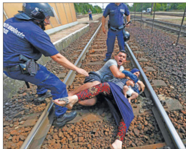
Vluchtelingen die gisteren gedwongen werden uit een trein te stappen om naar een opvangcentrum te gaan, hebben uit protest het spoor geblokkeerd.

een Duits probleem vindt, aangezien de meesten naar Duitsland willen. Dat Hongarije de vluchtelingen laat vertrekken richting het westen zou dan ook een logische stap zijn. Te meer omdat Oostenrijk, dat door veel vluchtelingen wordt gebruikt als doorreisland, te kennen gaf dat daar geen vluchtelingen worden tegengehouden. Tsjechië en Slowakije zeiden wel treinen met vluchtelingen tegen te houden.