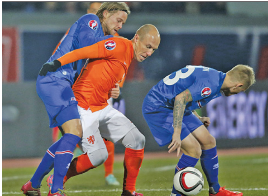
IJsland stond na dertig minuten al met een man meer in het veld. Oranje moest het zonder de geblesseerde Arjen Robben doen.

Het gastland miste in Konya kans op kans, totdat Selçuk Inan