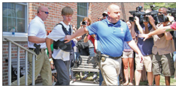
Dylann Roof heeft bekend op die mensen te hebben geschoten in de hoop een rassenoorlog te ontketenen.

Roof opende 17 juni in een historisch kerkgebouw in Charleston het vuur en richtte daarmee een groot bloedbad aan. Hij heeft bekend op die mensen te hebben geschoten in de hoop een rassenoorlog te ontketenen.