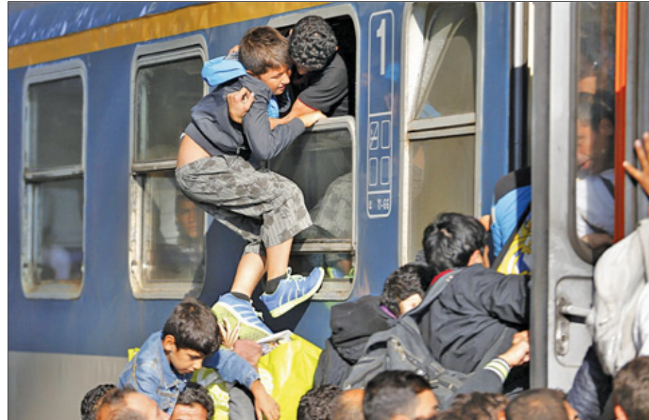
Rond het station Keleti in Boedapest was het gisteren een grote chaos van talloze mensen die met de trein naar West-Europa willen.

De Duitse club gaat bovendien een benefietwedstrijd spelen,