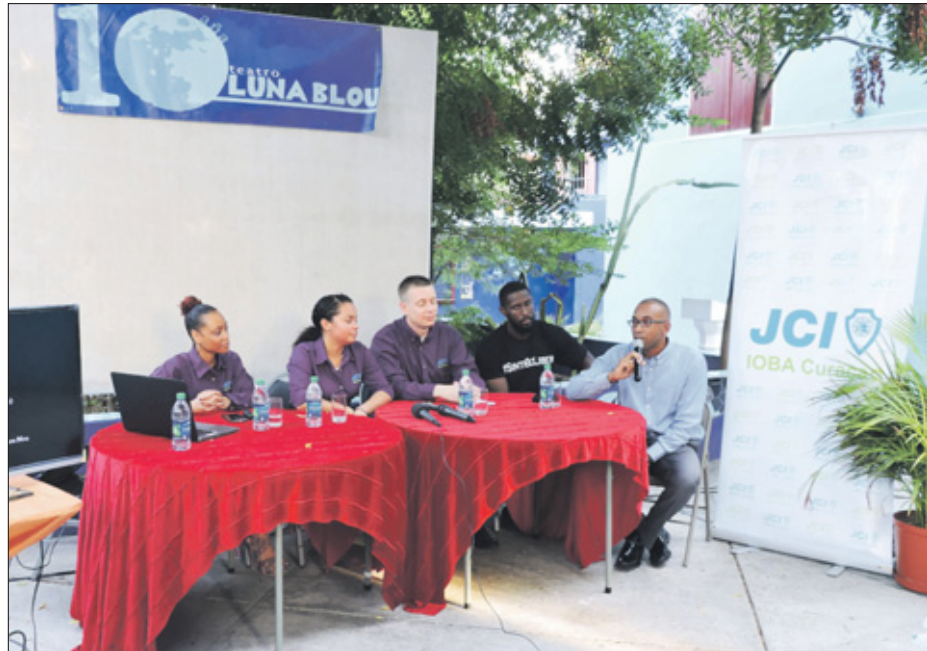
Het organiserende team tijdens de persconferentie van dinsdag.

Zijn nieuwe expositie 'Un dia den sirko' wordt komende zondag geopend. Hierbij zal Capricorne wel aanwezig zijn. Het thema van de expositie is niet nieuw. Een aantal schilderijen van deze serie was al te zien tijdens de expositie in 2013. De expositie geeft op satirische wijze weer hoe Capricorne denkt over de lokale politiek. Hij ziet de politiek en politici als circustent. Dit is volgens hem wereldwijd hetzelfde: alle actoren beloven van alles en nog wat om stemmen te winnen. In het schilderij 'Man di Oro' zijn bijvoorbeeld twee wuivende gou-