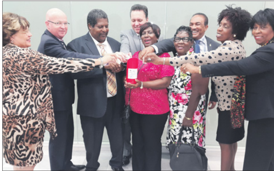
De ministerraad heeft gisteren bezoek gekregen van twee vertegenwoordigers van het Prinses Wilhelmina Fonds (PWF). De vertegenwoordigers kwamen langs om geld in te zamelen voor de stichting die meewerkt aan de bestrijding van kanker. Deze maand is de collectemaand van het Prinses Wilhelmina Fonds. Alle ministers hebben een donatie gedaan. Op de foto zijn (bijna) alle ministers te zien met de vertegenwoordigers van het PWF.