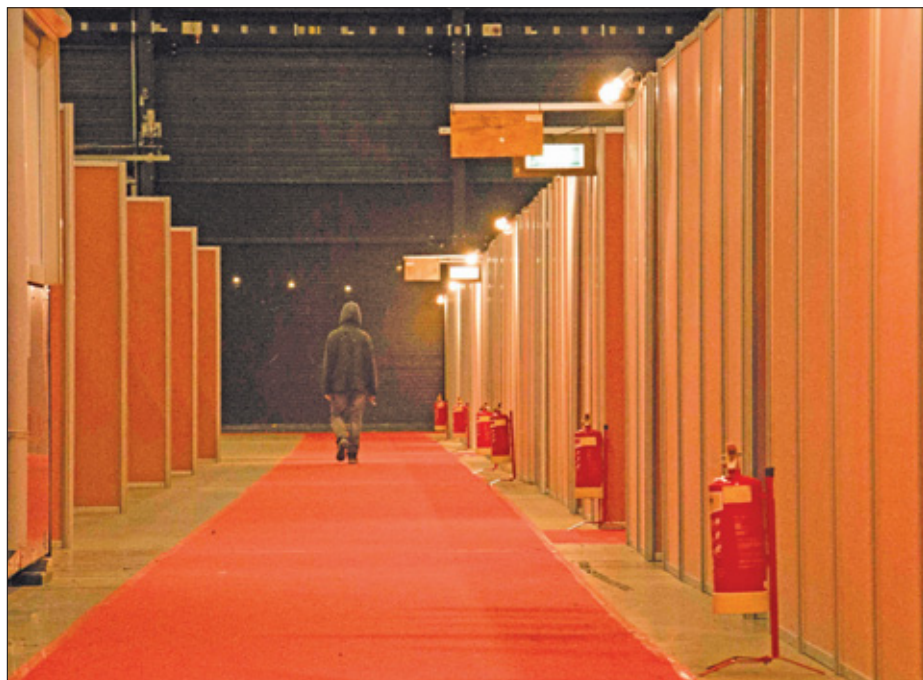
De TT-hal in Assen wordt ingericht als tijdelijke opvang voor asielzoekers.

De bestaande opvangcentra in Nederland zitten bijna helemaal vol. Het COA is druk bezig nieuwe plekken op te zetten. Bijvoorbeeld in het Autotron in Rosmalen, op een braakliggend veld